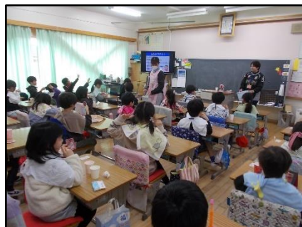
1月22日 | 1年生の様子

1年生のはみがきテストでは、初めて染め出しを行う児童もおり、緊張する様子が見られました。がんばって染め出しの薬を塗り、鏡で確認すると、一生懸命みがいたはずなのに、赤く染まっていることに驚いている様子が見られました。みがき方を覚えながら、最後はピカピカの白い歯で笑顔になっていました。