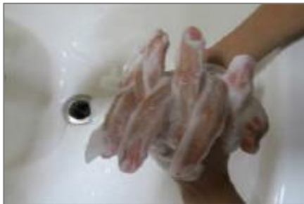
⑤握手して指の間をこする