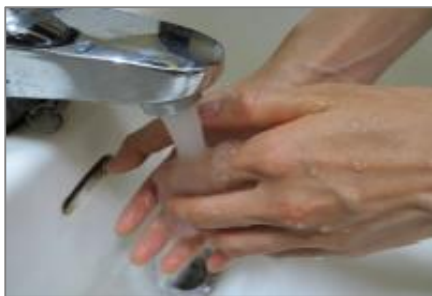
①水で汚れを洗い流す