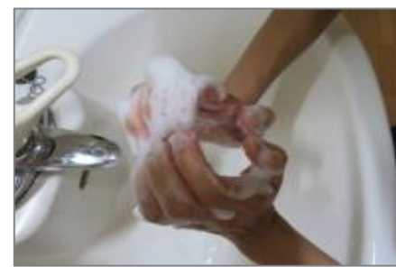
④指先、爪の間をこする