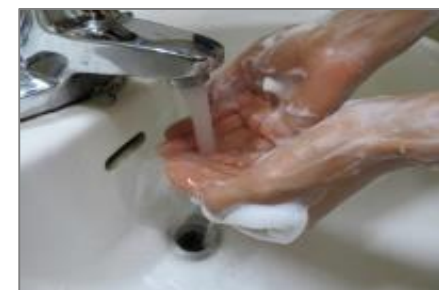
⑧せっけんと汚れを洗い流す