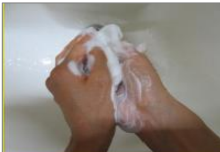
②せっけんを泡立てて、手のひらで5回こする