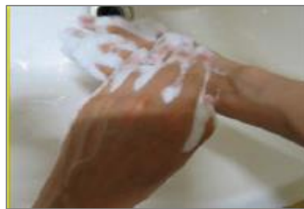
③手の甲をのぼすように洗う